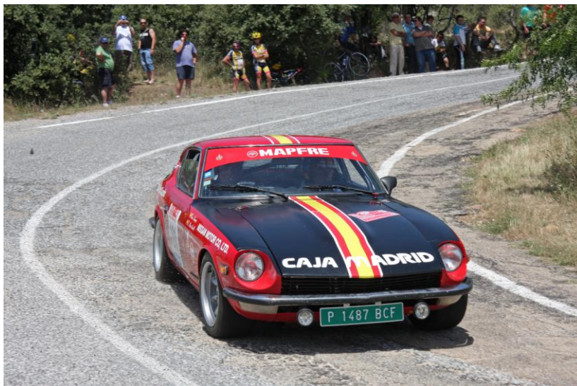
Gonzalo Rico-Avello, copilotado por Cuni Suarez, en el pasado Rallye de España Histórico