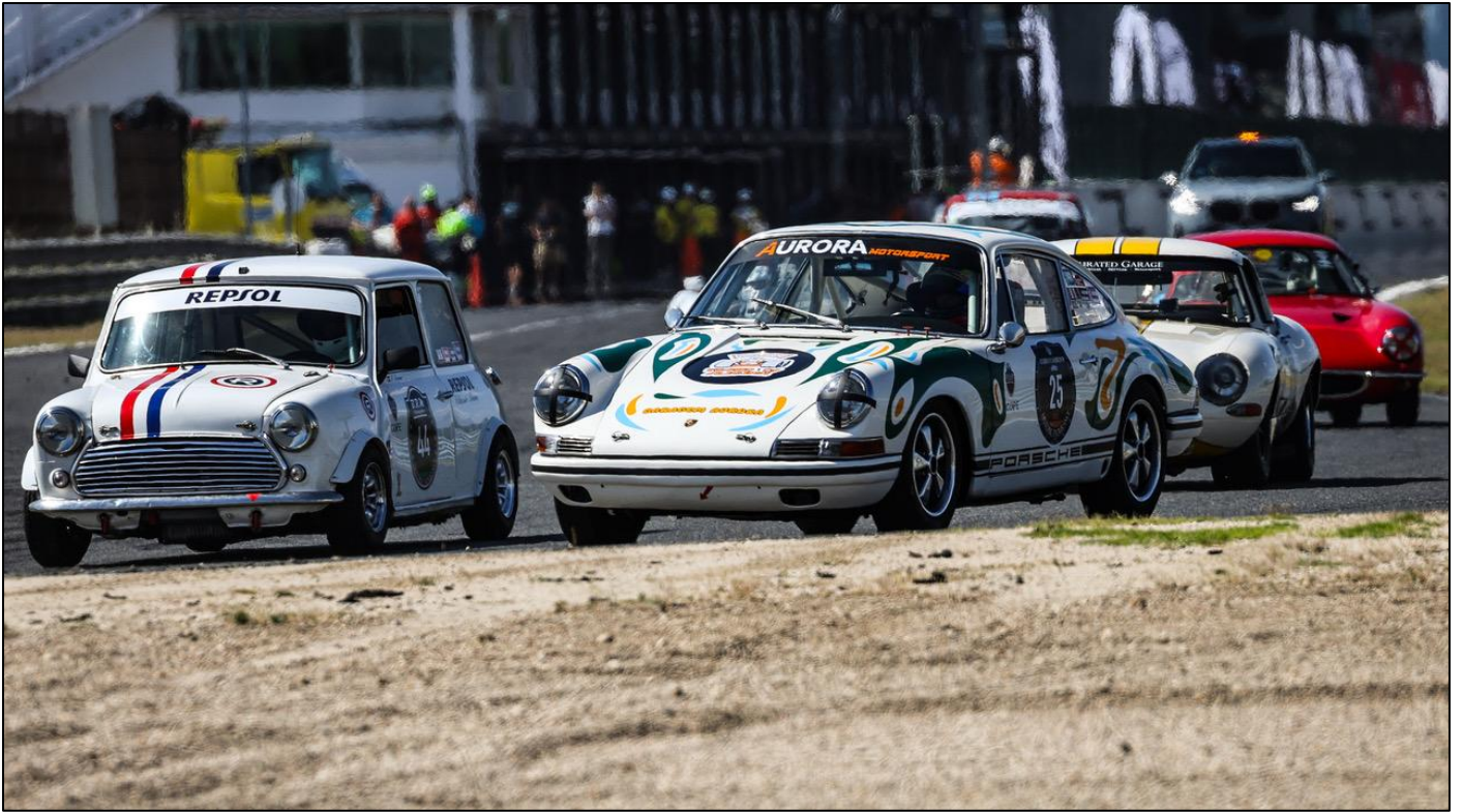
El Mini Cooper de Paco Serrano, haciendo un interior a uno de los Porsche 911 de Aurora.