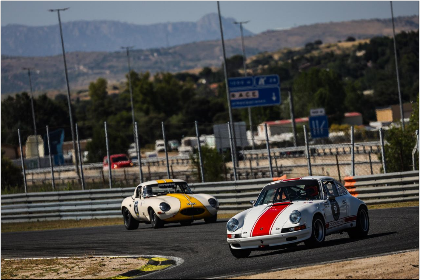
Nuestros socios Javier Basagoiti/Manuel Capelo, con el bonito Porsche 911ST, por delante del Jaguar E Type de Tim Mahapatra.